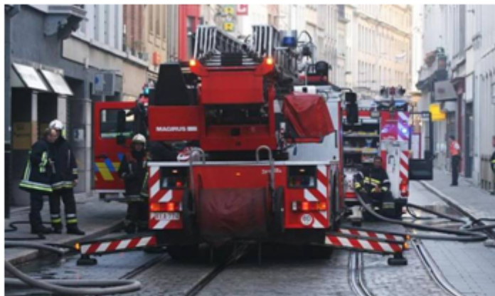
Brandweer: opstelling tijdens het blussen